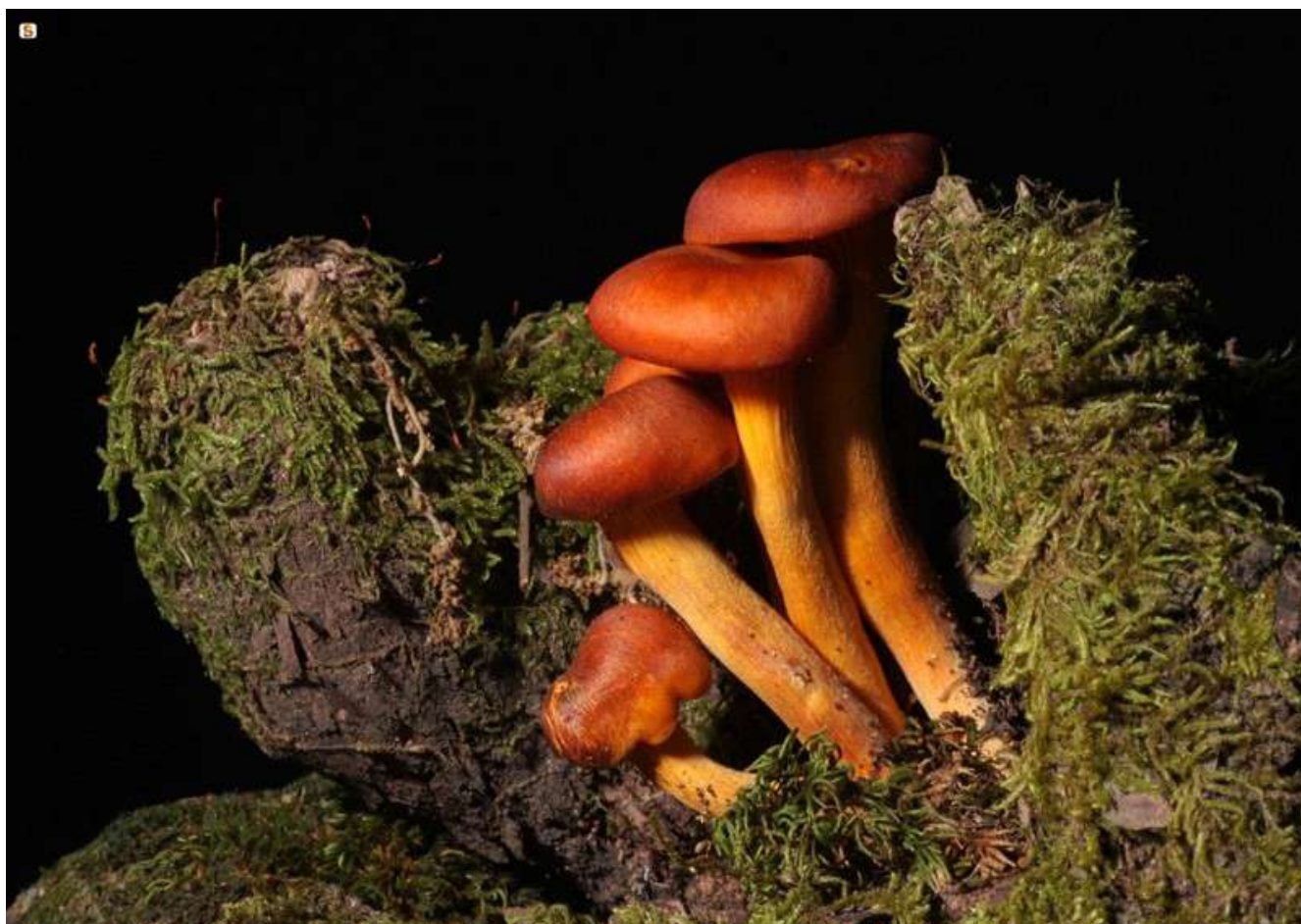
Autore: Antonello Chiaramida

DIREZIONE, REDAZIONE E AMMINISTRAZIONE: Presidenza della Regione – Viale Trento 69 09123 CAGLIARI Tel. 070 6061 – Sito Internet: http://buras.regione.sardegna.it/ – e-mail: pres.buras@regione.sardegna.it